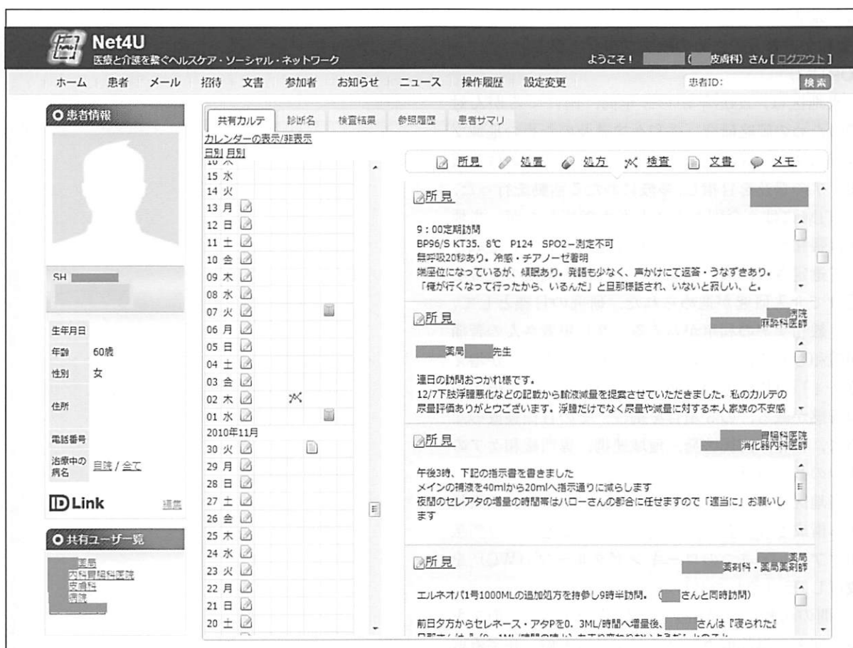
図 8 : Net4Uのカルテ画面

在宅緩和ケアを実施した実際の症例である。左下に、この患者に関わっている施設名が表示されている。中央がカレンダー表示で、ほぼ毎日、所見の記載があることが分かる。右が共有カルテ欄であるが、訪問看護師、病院PCT、在宅主治医、薬剤師が患者の病態、処方内容、コメントなど記載しバーチャルなディスカッションの場ともなっている。