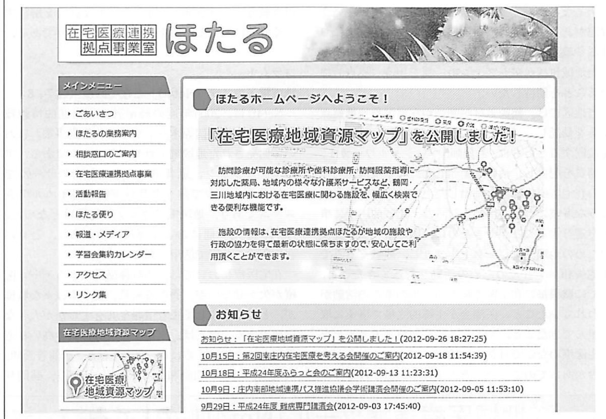
図6：「ほたる」のホームページ

ほたるの業務紹介のほか、活動報告、学習会のスケジュール、地域資源マップ、ショートステイ空き情報などが公開されている。